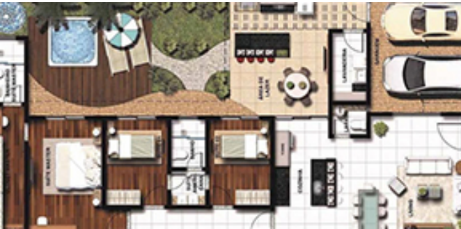
Ilustración de Planta Composición Arquitectónica

Conociendo las herramientas que posee Adobe Photoshop para la ilustración de plantas arquitectónicas con un acabado que tenga impacto al cliente.